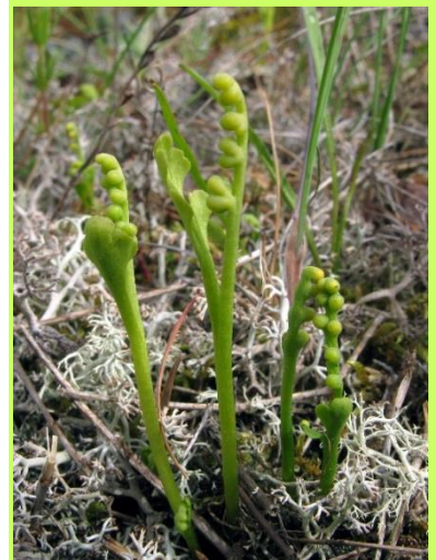
Pysslinglåsbräken, Botrychium tenebrosum , ny på rödlistan

Biotopia kl. 18.00. Alla är välkomna! Samarrangemang med Entomologiska Föreningen i Uppland och Biotopia.