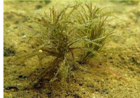
Sjönajas