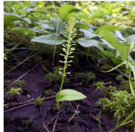
Knottblomster