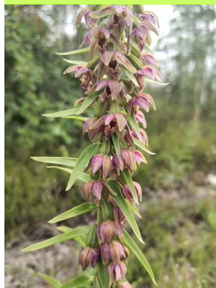
Tallknipprötter från Marma Skjutfält.

Bli medlem! Medlemsavgiften är 150 kronor för 2021 och betalas in på pg 327956-9 eller via Swish till nummer 1234732467. Du får information om alla föreningens aktiviteter samt tidskriften Daphne två gånger per år. Glöm inte att skriva namn, adress och mejladress när du betalar, samt meddela adressändring om du flyttar.