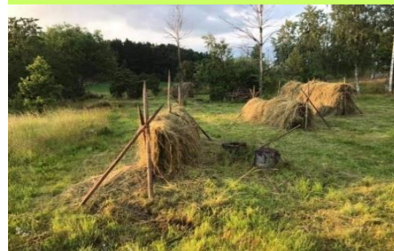
Visningen sker virtuellt via Facebook - ta del av sändningen genom att följa föreningen ( Biotopia skriver "Upplands Botaniska Förening") eller Biotopia på Facebook. Det kommer även att finnas ett särskilt facebook-event för livesändningen. Livesändningen är ett samarrangemang med Biotopia.