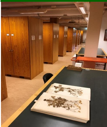
Botaniska samlingar - 1600-tal och framåt. Tisdag 3 november kl 18.00

Museiintendent Mats Hjertson vid Evolutionsmuseet (Uppsala universitet) visar runt i de botaniska samlingarna. Från nyinsamlat material till museets äldsta samlingar från början av 1600-talet. Vad är ett herbarium och vad används det till?